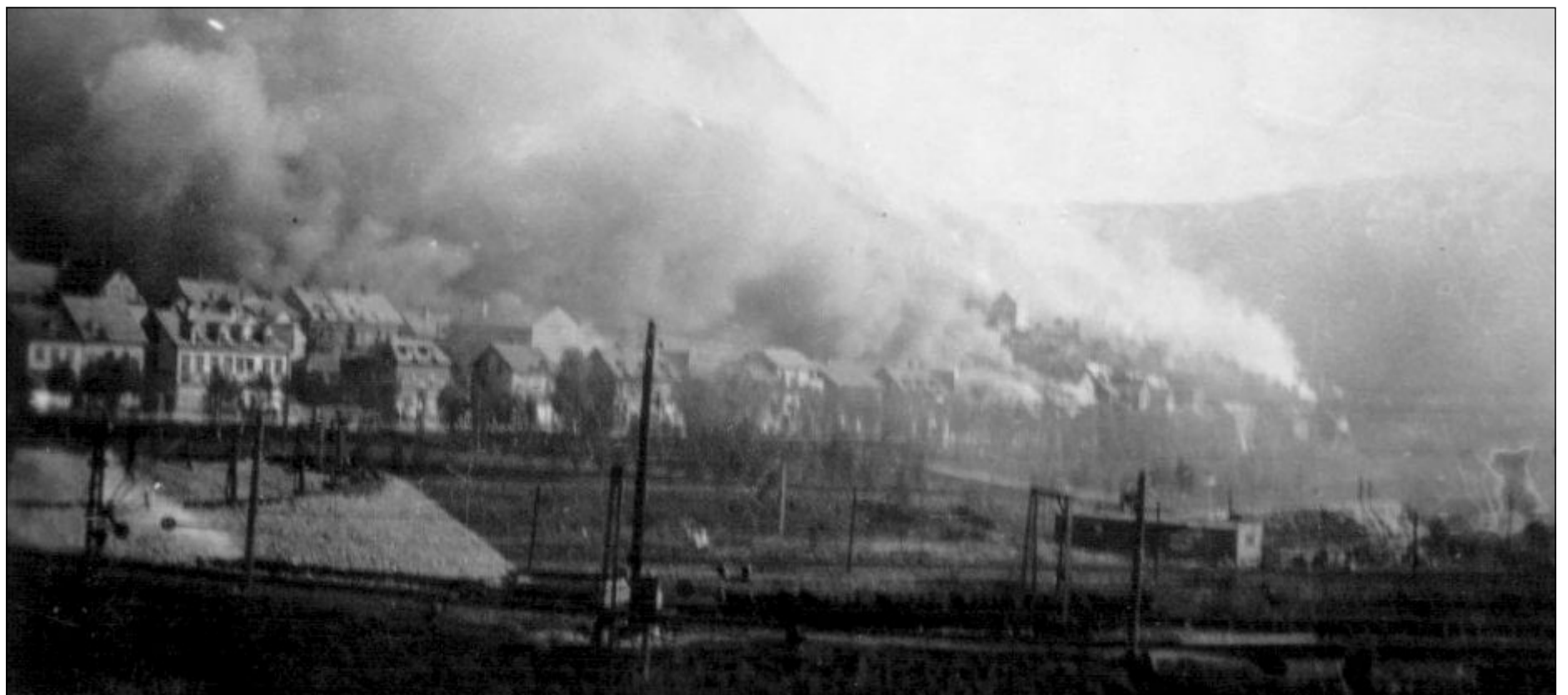
NARVIK 1940: Gjennom årene er det skrevet mange bøker om de dramatiske hendelsene i Narvik-området våren 1940.